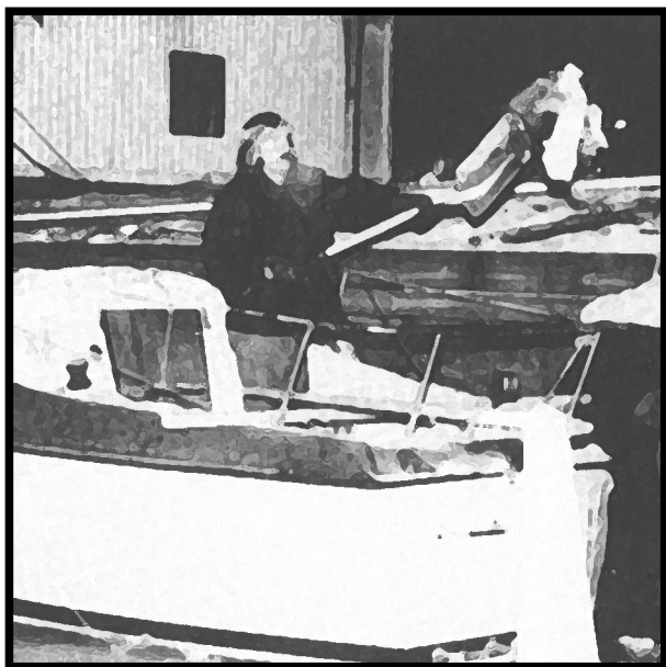
Fastfrosset i Frognerkilen.